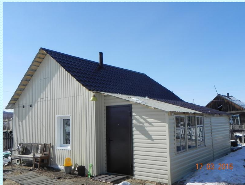
Служебное - жилое помещение