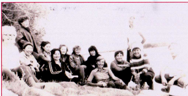
На субботнике по уборке сельхоз культур с работниками сельского совета 1986г